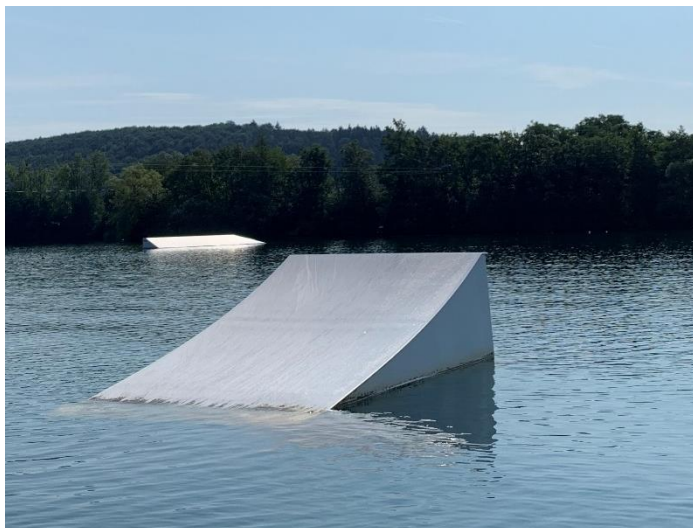
Left side: Unit L Kicker