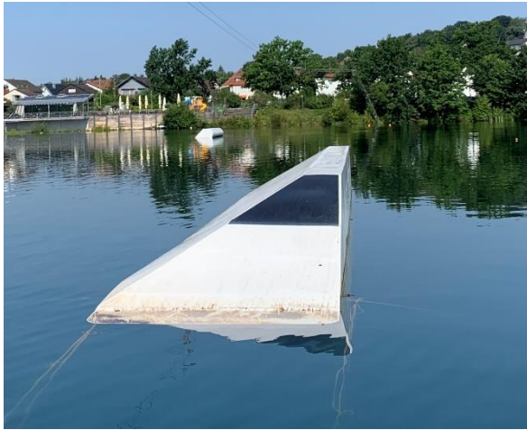
Right side: Unit Bank Ledge