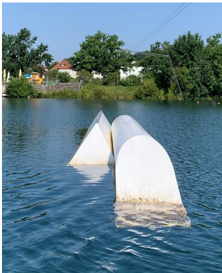
Left side: Unit Pipe + Unit Triangle Hack