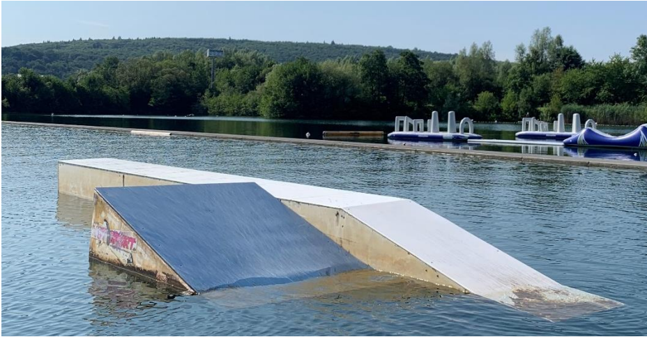
Right side: Kicker + Table Hack