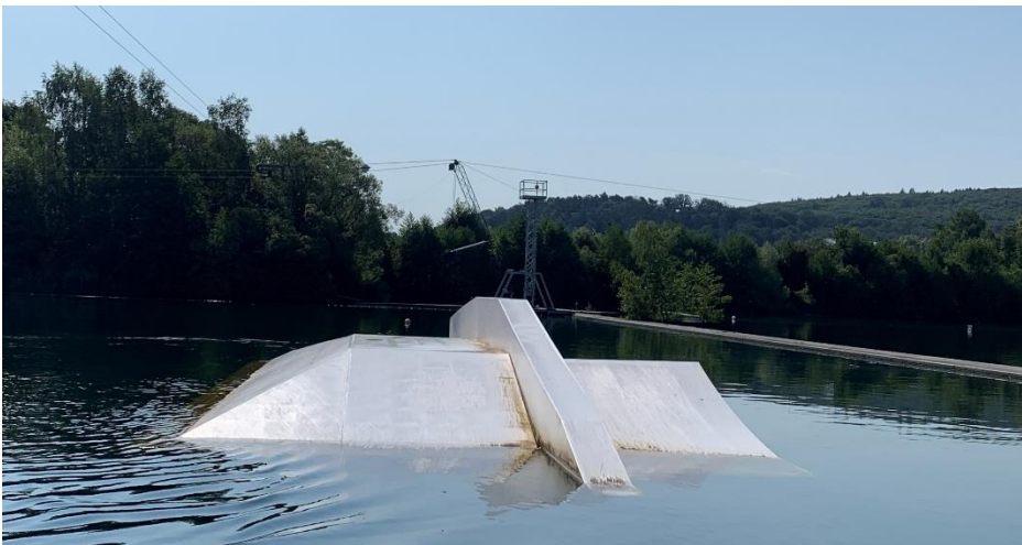
Right side: Rixen Vanni Funbox