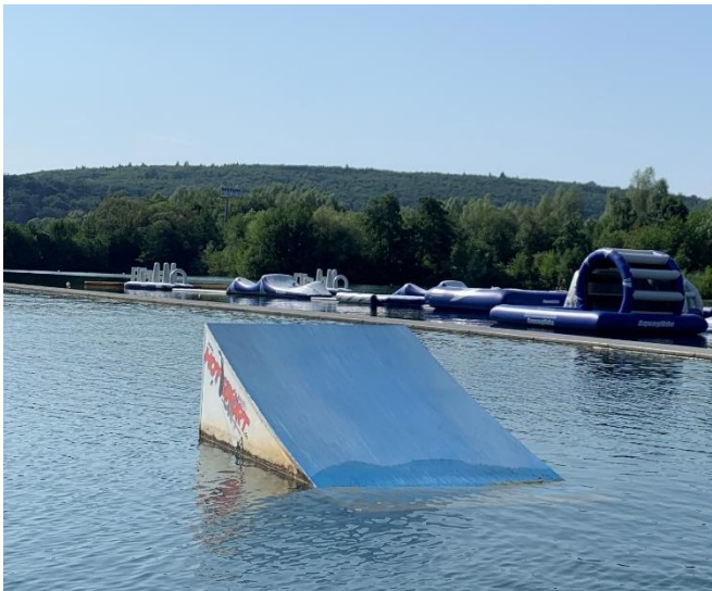
Right side: Kicker