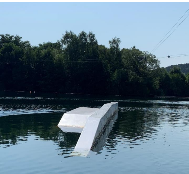
Left side: Shape Rooftop box